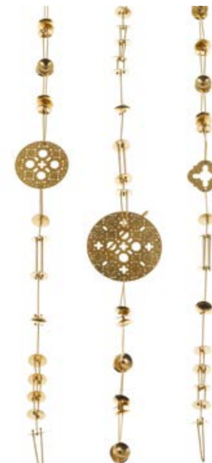
VENEZIA Variazioni Ritmiche // 1980 Catena costruita a piccoli dischi impernati tra loro con fili di varie lunghezze. Contiene 3 toni traforati a mano con motivi arabo-bizantini. Chiusura a t-bar. AU 750 // Lunghezza cm. 120 diametro disco maggiore cm 3,2