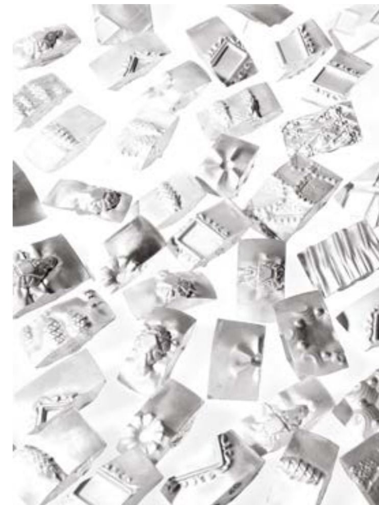
IMPRONTE installazione // 2013 Piccoli Pendenti a forma rettangolare impressi con madreforme su entrambi i lati. Lastre AG 925 di 0,15 mm di spessore // Dimensioni medie cm 2,5x 4 x 1.

vive e lavora a Bassano del Grappa Tel. (+39) 0424 32653 Mobile (+39) 335 5264144 info@carlariccoboni.it www.carlariccoboni.it